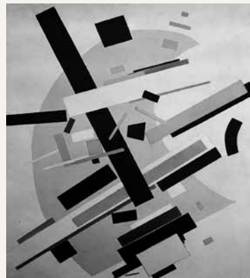
Kazimir Malevitch Suprématisme (1916)