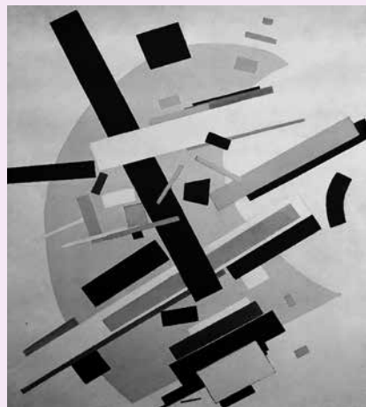
Kasimir Malevitch Suprématisme (1916)